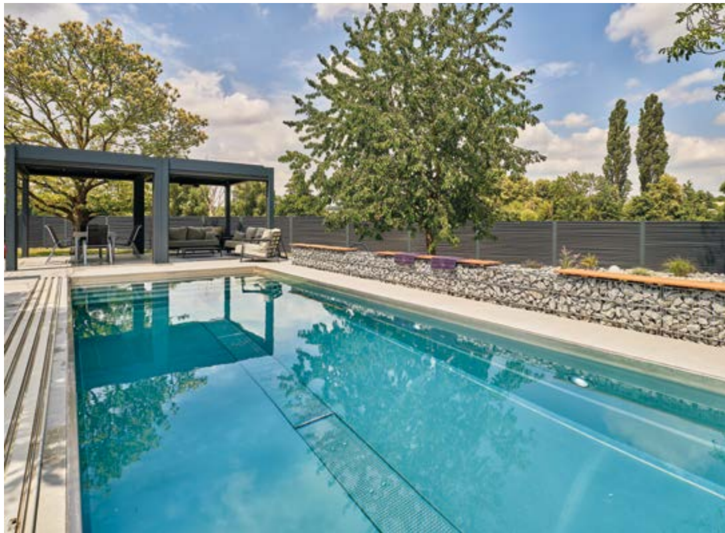
Pavillon und Poolanlage sind eine Wellnessoase im Freien geworden, die für die ganze Familie ein Stück mehr Lebensqualität bedeutet. Hier kann man entschleunigen und den Alltag hinter sich lassen.

SEIT SICH DIE FAMILIE mit den drei Kindern einen Pool auf ihr Grundstück bauen ließ, hat sich die Lebensqualität aller Beteiligten deutlich verändert. Der neun Meter lange Pool aus Edelstahl ist zum Mittelpunkt des Gartens geworden. Die Erwachsenen können sich beim Schwimmen im Becken – oder auch beim Relaxen am Beckenrand – vom Tagesstress erholen. Und die Kinder haben einfach nur Spaß, wenn sie im Wasser planschen und spielen können. Angenehmer Nebeneffekt: Durch den Pool hat der Nachwuchs der Familie in kurzer Zeit Schwimmen gelernt. Auch rein optisch ist das neue Schwimmbecken zu einem Highlight geworden. Das liegt nicht zuletzt am hochwertigen Material Edelstahl, das mit vielen positiven Eigenschaften punkten kann. Edelstahl ist widerstandsfähig und langlebig. Das Material ist UV-unempfindlich und sowohl im Sommer wie auch in der kalten Jahreszeit wetterfest. Zudem ist Edelstahl sehr hygienisch. Seine porenfreie, ge-