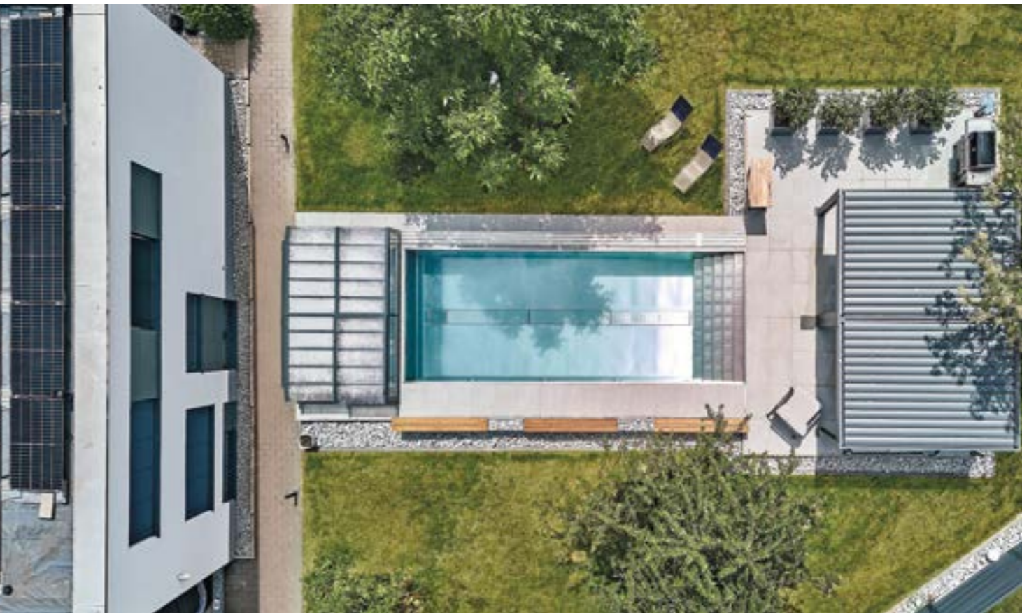
Auf dem großen Bild links sieht man einen Pavillon am Kopfende des Beckens. Hier gibt es genügend Sitz- und Liegeflächen, so kann man vor oder nach dem Schwimmen ganz entspannt die Umgebung genießen. Auf dem Bild oben kann man am linken Rand die Photovoltaik-Anlage auf dem Dach des Gebäudes erkennen.